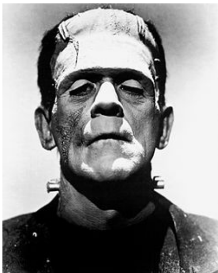
Så här såg monstret ut i filmen från 1931.